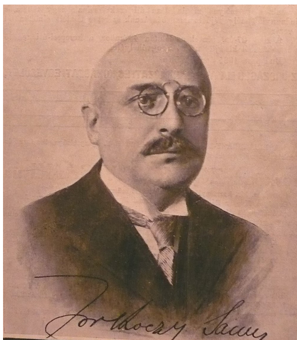
Zorkóczy Samu portréja [4] (1869. november 9., Radvány – 1934. április 25., Budapest)

Mielőtt az Egyesület 8. elnökének, egy igazán kiváló embernek az élettörténetét röviden összefoglalnánk, engedje meg a Tisztelt Olvasó, hogy egy lehetséges zavart azonnal elhárítsunk. A „Zorkóczy név” nagyon jól hangzik a Miskolci Nehézipari Műszaki Egyetemen végzett gépészmérnökök, hegesztő szakmérnökök ezreinek azon körében, akik tanulmányaikat 1950 - 1970 között folytatták. Ők – és közöttük jómagam is – Zorkóczy Bélától hallgathattak sok-sok olyan tantárgyat, amelyeket szakmai életükben gyümölcsözően használhattak (mechanikai technológiák, hegesztés legkülönbözőbb eljárásai, hőkezelés, metallográfia, anyagvizsgálat...). Zorkóczy Samu és Zorkóczy Béla között – a családi név azonossága ellenére – semmilyen kapcsolat nincs. Ez egyébként egyértelműen kiderül tisztelt és szeretett professzorunk életét ismertető írásokból [1, 2]. Az ARCANUM adatbázis alapján is hasonló megállapítást tehetünk [3].