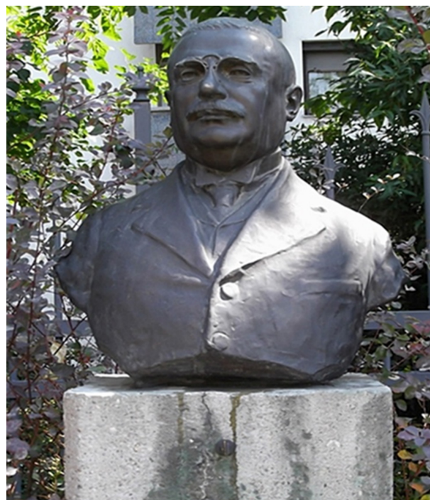
Zorkóczy Samu mellszobra [16]