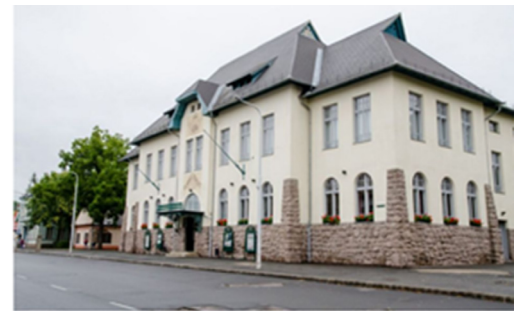
Az 1924. október 24.-én megnyílt Olvasó Egylet Székház (újjaépítve) [12]