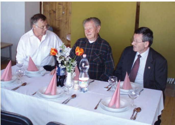
3. Kép. Az ünnepi asztal egyik pillanata

Néhány alkalommal Páczelt István akadémikus is társ volt a látogatásokban. Az egyik ilyen alkalomra a 92. születésnap adott alkalmat. Az ekkor készített