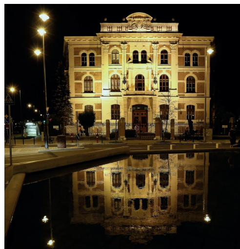
A BME Czigler Győző által tervezett, épített CH épülete (Készítette Thaler Tamás)

A gyászszertartást a Műegyetem általa tervezett CH épületében (alábbi kép) tartották délután 3-kor. Innen indult a temetési menet a Kerepesi úti sírkertbe [3.1].