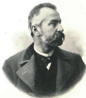
Czigler Győző (1950. július 19., Arad – 1905. március 28., Budapest)

Az ősi Czigler család Svájcból költözött hazánkba valamikor az 1700-as években. Akadnak olyan vélemények is, hogy már Czigler Győző széppapja is építészettel foglalkozott. Az azonban tény, hogy nagyapja id. Czigler Antal (1767, Cserevics – 1862, Kígyós) már széleskörű építési tevékenységet fejtett ki Békés, Arad és Bihar vármegyékben. Nevéhez 25 templom építése (közöttük a békéscsabai evangélikus templom), temérdek kúria és lakóház tervezése és elkészítése, valamint Herkulesfürdőn,